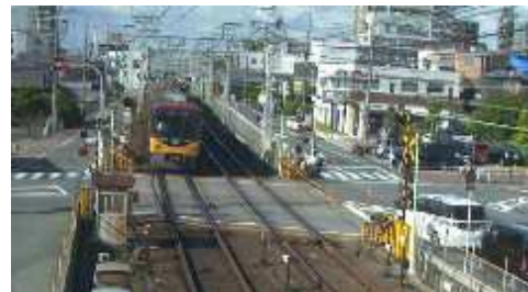
踏切監視カメラが撮影した画像

踏切の状況確認や記録を目的とした監視カメラを設置しています。2020年度末時点で京阪線の全踏切道に設置が完了しています。