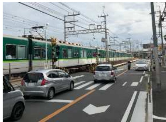
現況 (光善寺駅～枚方公園駅間)

この事業は、香里園駅・光善寺駅・枚方公園駅の3駅を含む京阪本線約5.5kmを高架化するもので、21カ所の踏切が除去されることで、交通渋滞の緩和や運転保安度の向上につながります。