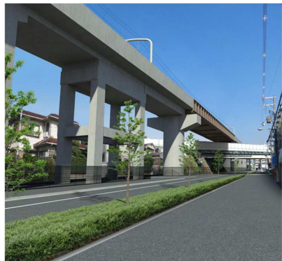
完成後 ※画像は現段階でのイメージです。