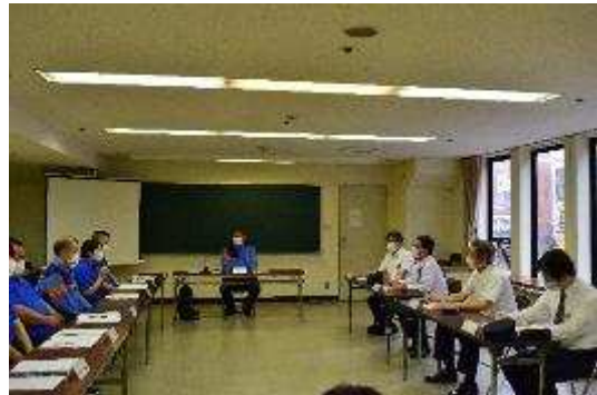
巡視時の意見交換