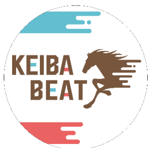
「競馬 BEAT 号」 ヘッドマーク