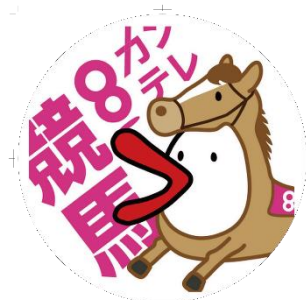
ハチエモン ヘッドマーク