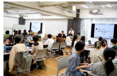
ひらかたパークスタッフが臨時講師として講義に参加。