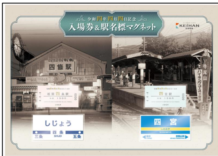
記念入場券(硬券)・駅名標マグネット・台紙(イメージ)