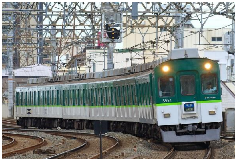
▲9月に引退する5000系車両