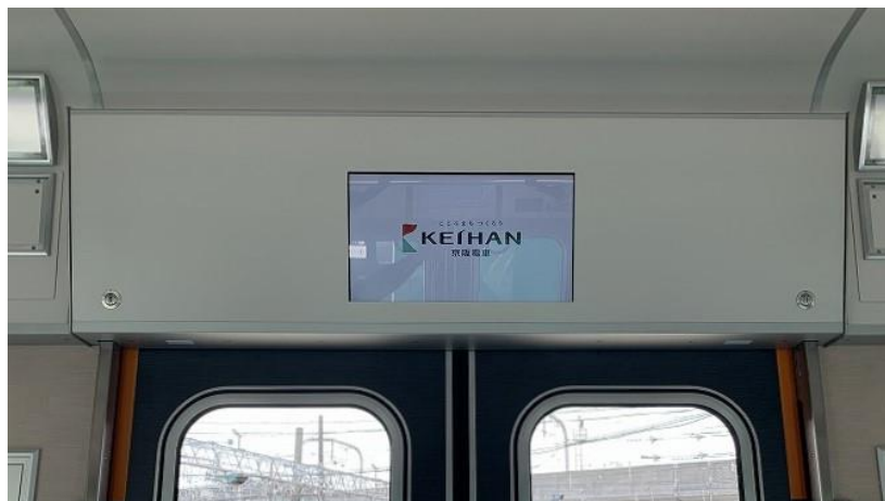
▲車内に設置した広告用デジタルサイネージ