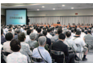
第88回定時株主総会 (平成22年6月24日、大阪マーチャントアイズ・マートビル)

株主総会の活性化および議決権行使の円滑化を図るため、株主総会招集ご通知の早期発送に取り組んでいるほか、株主総会の集中日とは異なる日程で株主総会を開催しています。