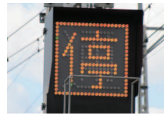
駅誤通過防止装置

停車駅の誤認を防ぐため、接近する列車の種別により、駅手前に設置した表示灯に「停」または「通」の文字を表示するとともに、ATSと連動させ停車列車の駅誤通過を防止する装置で、京阪線の9駅に設置しています。